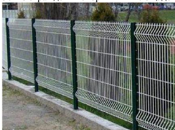
Эскиз ограждения спортивных площадок

Дерево хвойных пород, лакокрасочное покрытие. Полимерный профиль, порошковая покраска каркаса в любой цвет .