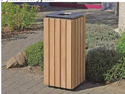
Эскиз уличной урны